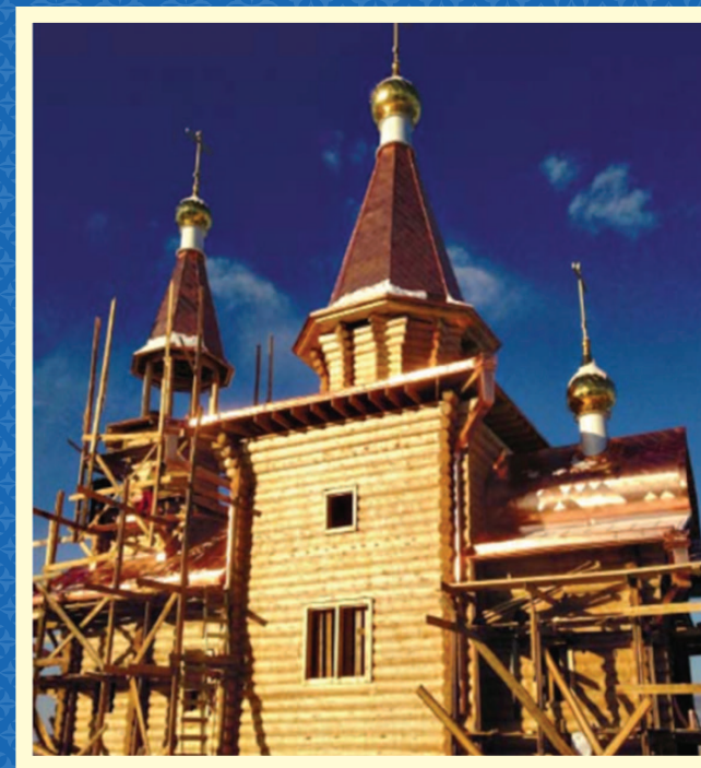
Строительство храма в селе Анга 2014 г.