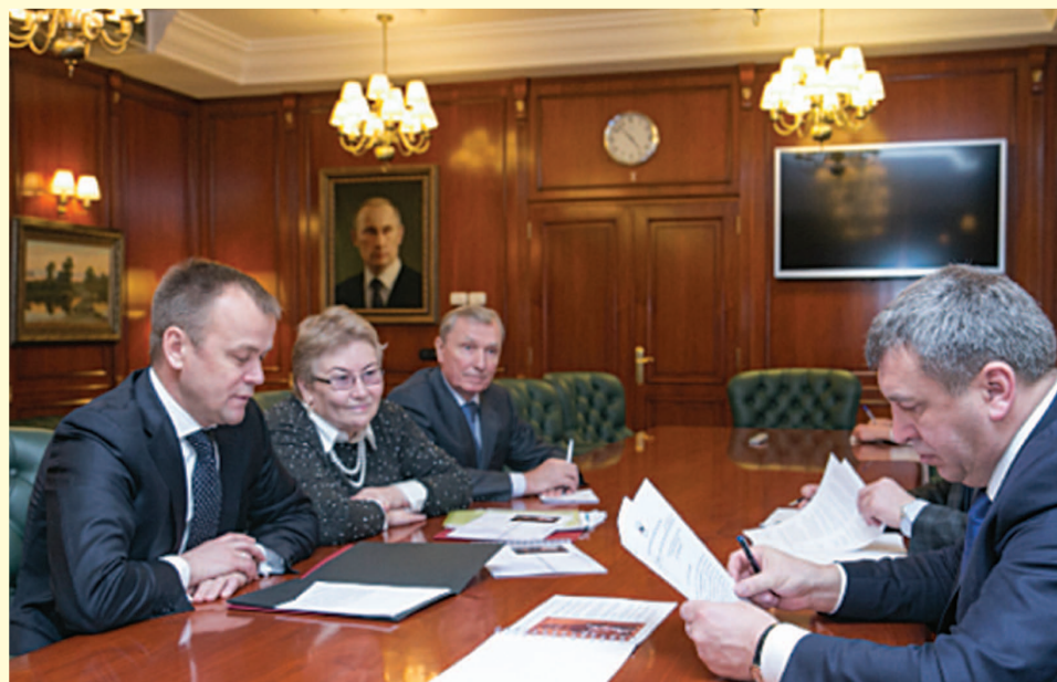
Встреча Губернатора Иркутской области С.В. Ерощенко с Министром регионального развития Российской Федерации И.Н. Слюняевым

Обсуждение духовно-просветительского проекта «Путь Святителя Иннокентия»