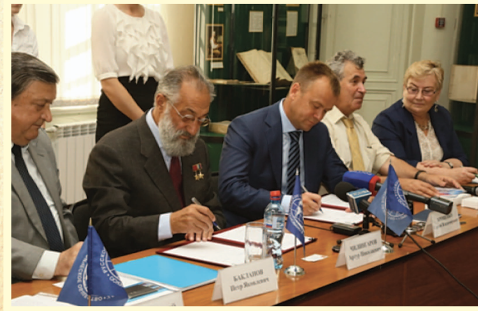
Проект впервые был представлен и одобрен участниками 26-27 июля 2013 г.