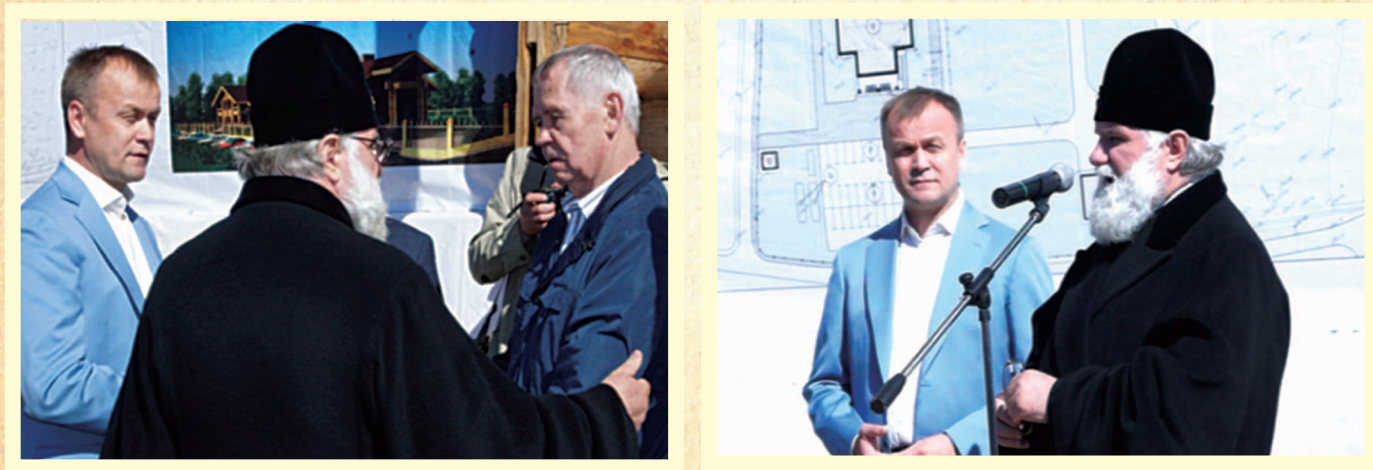
Губернатор Иркутской области С.В. Ерощенко, Митрополит Иркутский и Ангарский Вадим, писатель В.Г. Распутин